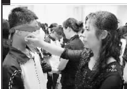
母亲节里的特殊班会。