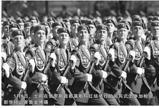
5月9日，士兵在俄罗斯首都莫斯科红场举行的阅兵式上参加检阅。

后，T-90主战坦克、步兵战车、伞兵战车、S-400防空导弹、“白杨”机动式导弹、“伊斯坎德尔”战役战术导弹等112件重型武器依次经过红场。包括图-160型战略轰炸机、安-124型军用运输机、伊尔-78空中加油机、卡-52武装直升机、最新型的“苏霍伊”和“米格”战机在内的69架直升机和飞机掠过红场上空。近9000名官兵参加的阅兵式持续了约1小时。