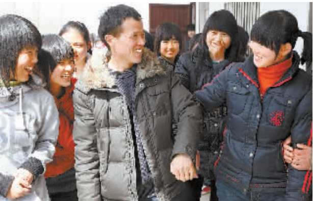
课余,用心与学生交流。