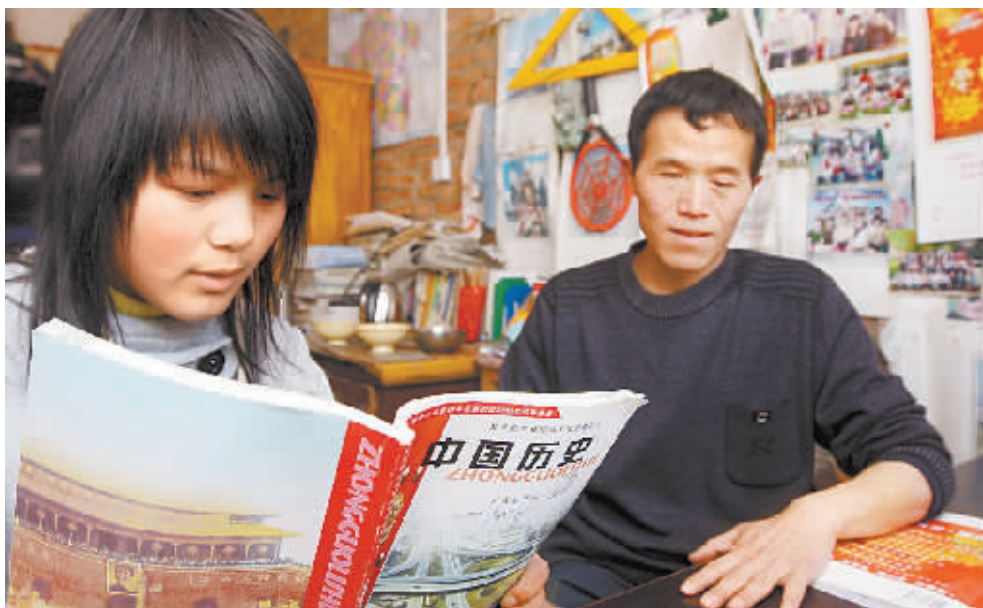
课前,借助学生的眼睛备课。