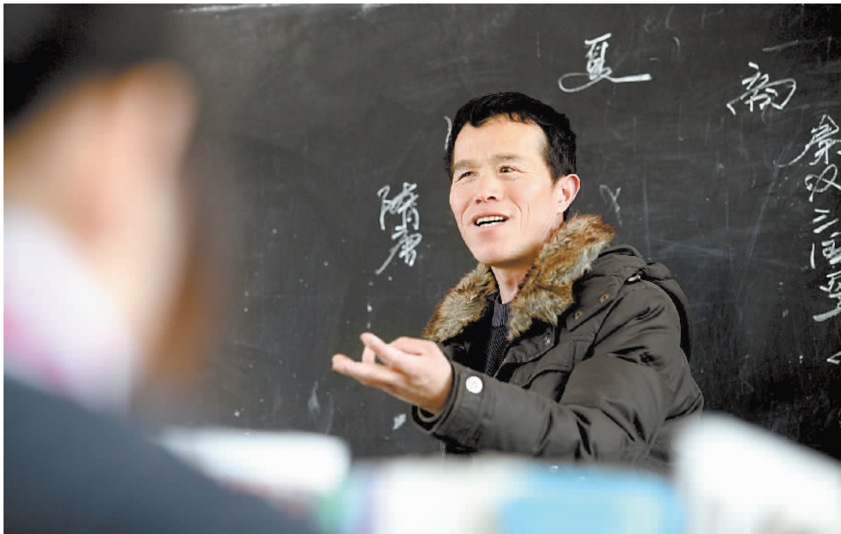
课堂上,精彩的讲授。