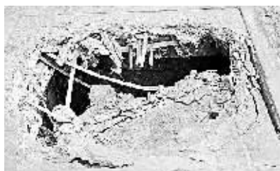
这样的窨井盖, 咋会不出事?