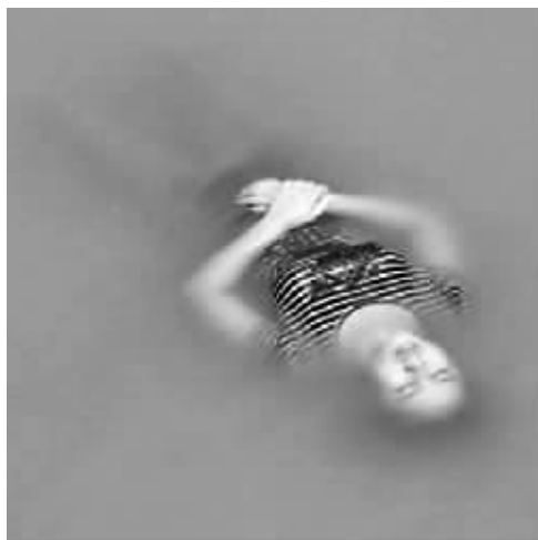
张女士被发现时,警方拍下了照片。