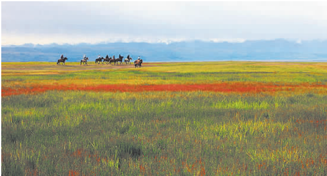
▲策马巴音布鲁克草原