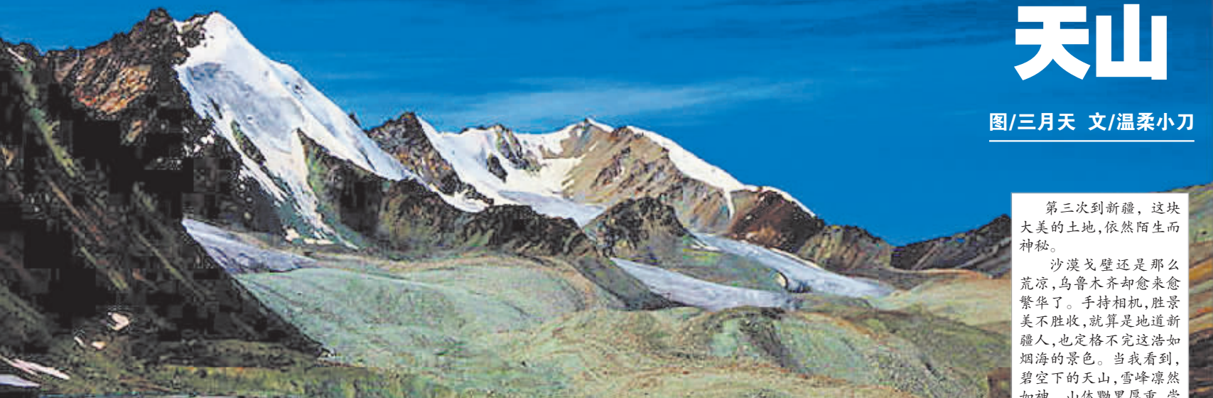
▲天山雪峰,孤傲挺立