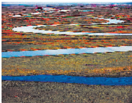
▲天山腹地,九曲十八弯的开都河

走马观花,相机拍摄的只是有限的风光,而在心中的留存,更多的是一份对自然的感动。这些照片,权作为回忆的开关,以期今后每每翻看,都能享受这次幸福的旅程。