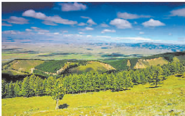
▲秀美的巴里坤草原