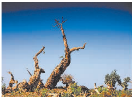
▲伊吾胡杨,千年不朽