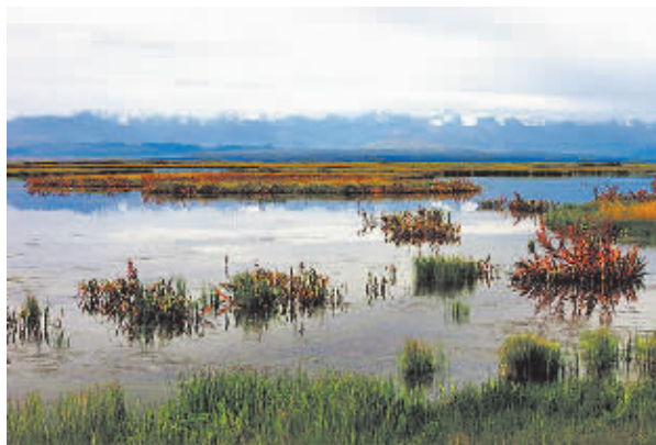
▲水草丰美的天鹅湖