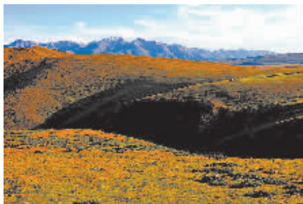
▲雄浑的天山,大地的脊梁