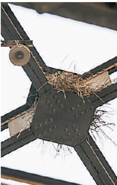
鸟儿在大桥上筑巢