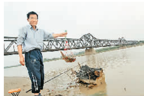
收获黄河鲤鱼的喜悦