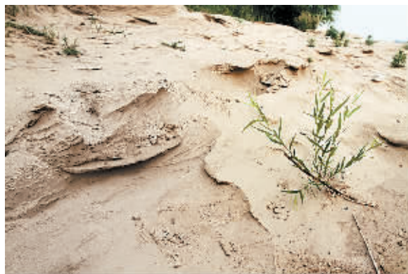
黄河水流走后留下的泥沙痕迹