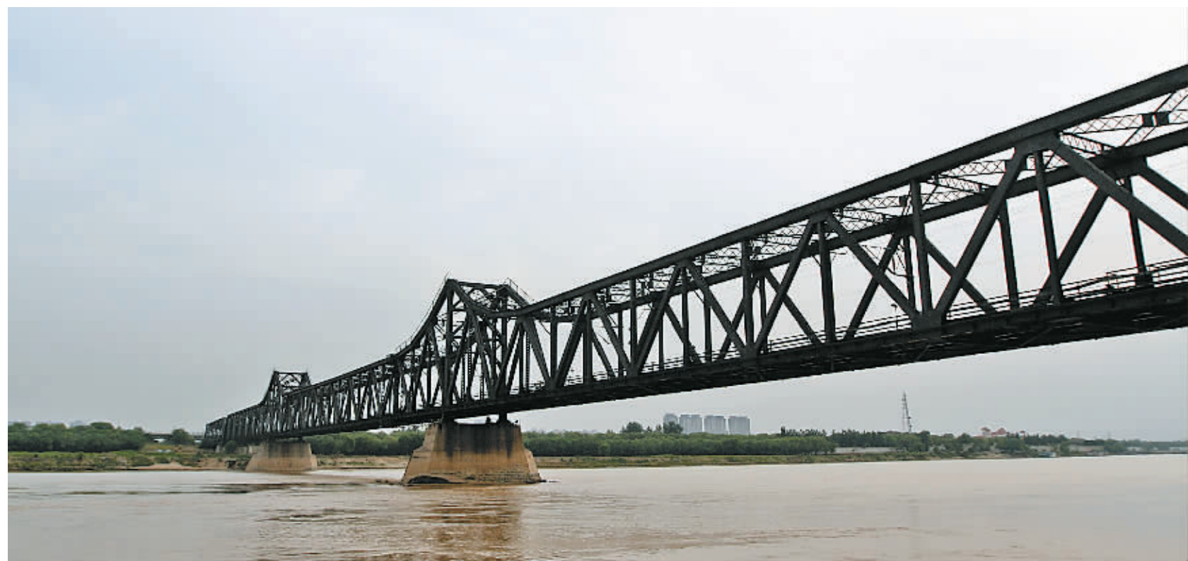
有着100多年历史的黄河铁路大桥