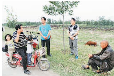
采访黄河岸边的居民