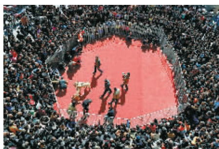
◀3月2日,山西省运城市新绛县泽掌镇大聂村举办民间斗狗闹元宵活动,附近的60多条不同品种的狗参加比赛,吸引数百名群众前来观看。