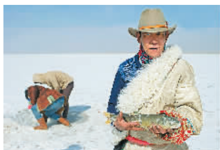
◀冬季,青海湖冰封。这时候,一些盗捕湟鱼的捕猎者开始活跃起来。为打击盗捕行为,一支由30个左右志愿者和牧民组成的“青海湖湟鱼巡护队”于2010年成立,主动对接和协助当地渔政部门,宣传湟鱼保护,制止非法捕捞行为。