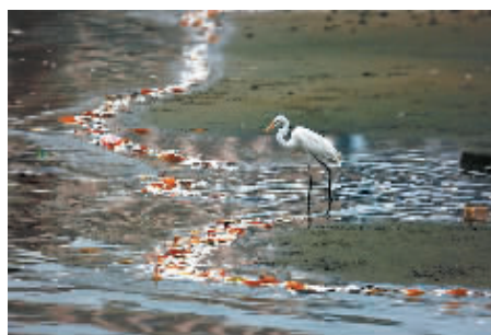
◀3月3日,海南省三亚市三亚河出现大量死鱼,引来无数白鹭抢食。出现大量死鱼的河段,腥臭味给晨练的市民带来不快。死鱼一般仅有拇指大小,当地人叫“西子鱼”。