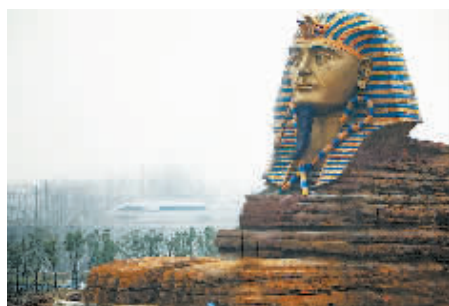
◀3月3日,安徽滁州,一处基本完工的“狮身人面”雕像吸引了人们的眼光。该像位于“滁州长城国际影视动漫旅游创意园”二期的“世界文化遗产博览园”。