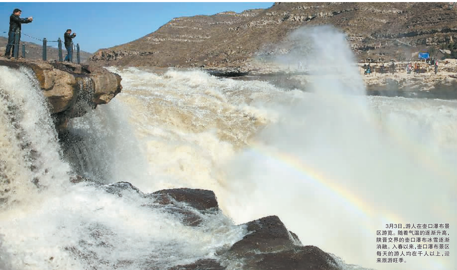
3月3日,游人在壶口瀑布景区游览。随着气温的逐渐升高,陕晋交界的壶口瀑布冰雪逐渐消融。入春以来,壶口瀑布景区每天的游人均在千人以上,迎来旅游旺季。