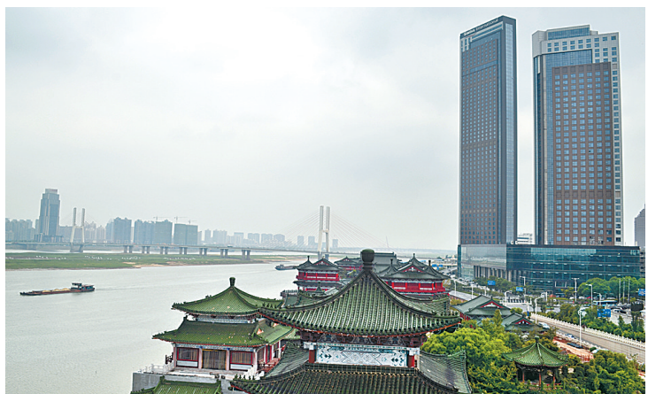
● 古今文明