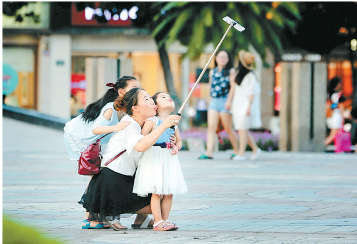
● 萌态可掬