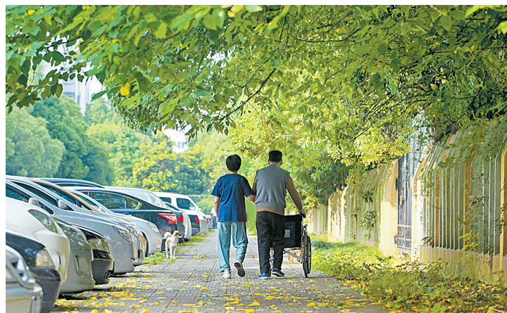
● 一路上有你