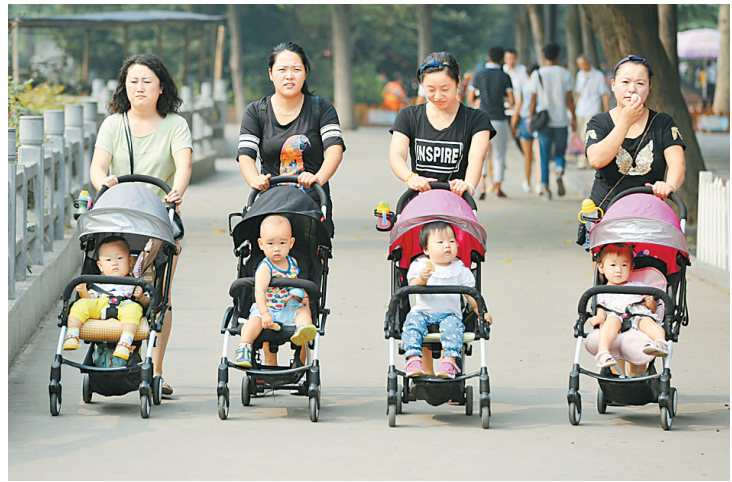
● 辣妈正传