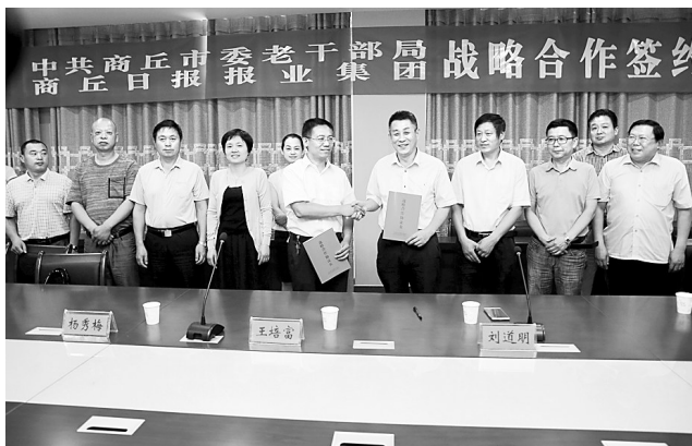
签约仪式现场

本报讯 6月24日上午,商丘市委老干部局与商丘日报报业集团战略合作协议签字仪式在市老干部活动中心举行,双方本着平等互利、双赢发展、资源共享、优势互补、长期合作的原则,针对有关宣传合作事宜达成一致意见。 双方协议明确,市委老干部局要为商丘日报报业集团经常性提供有关离退休干部先进事迹和工作新闻宣传报道素材,为报业集团拓展新闻采编业务提供工作支持;报业集团为老干部工作的宣传报道提供全面服务,在报纸上提供专门版面或开辟专刊。双方商定在市委老干