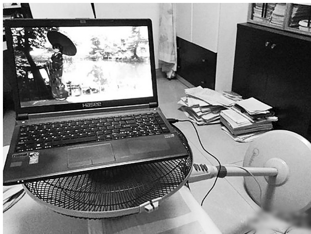
给电脑散热的高招

今天出门坐公交，车来了，一掏兜没零钱，正一筹莫展之时，一个乞讨者站到了我面前，把手中的钱缸伸向了我，晃了晃里面的零钱，我摇摇头，他还是坚持地伸过来再次摇了摇缸子。一瞬间我的眼睛湿润了，我冲他点了点头，从里面拿了一块钱登上了缓缓启动的公交车。站在车上，我看着车外的他一边追赶着车一边在喊什么……我再也控制不住了，猛地打开车窗大声喊：“谢谢你大哥，一块钱就足够了，这不是空调车！”说完我关上了车窗，心情久久不能平静。