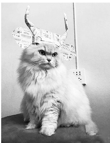
看，整个天下都是朕的