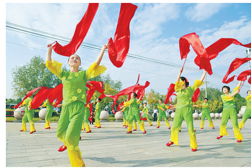
喜迎辣椒产业大会

椒大市场建成后，将进一步巩固雄踞中原、辐射全国、面向世界的辣椒交易集散枢纽。 红火小辣椒，脱贫大产业。为推动辣椒产业向更高层次、更高水平发展，我们与中原银行合作建立了规模20亿元的三樱椒发展专项基金，配合郑州商品交易所积极推进辣椒期货市场建设，支持12家辣椒企业成功在中原股权交易中心集中挂牌，在财税、土地、融资、用工等方面出台一系列优惠政策，重点支持辣椒规模种植、精深加工、市场建设、挂牌上市。力争通过3至5年的努力，重点培育2家上市企业，使挂牌企业达到30家以上，建成储量达50万吨的辣椒期货交割基地，辣椒年交易额力争突破200亿元，使柘城成为中国乃至世界具有较强影响力的辣椒种植加工、集散交易中心。 大美柘城，椒香天下。柘城辣椒产业发展取得的丰硕成果，不仅有广大椒农的辛勤付出，也得益于省市领导和各界的大力支持，在此向您们表示衷心的感谢！柘城是一方开放的创业热土，这里民风淳朴、文化厚重、环境优美、商机无限。我们衷心希望与国内椒业同仁，携手合作，进一步做大做强辣椒产业，让柘城辣椒叫响全国、让中国辣椒红遍世界！