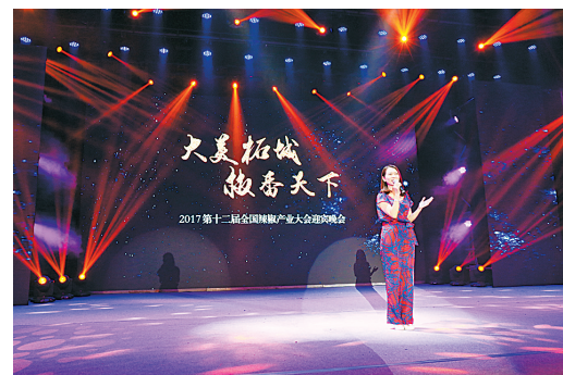
“大美柘城、椒香天下”迎宾晚会