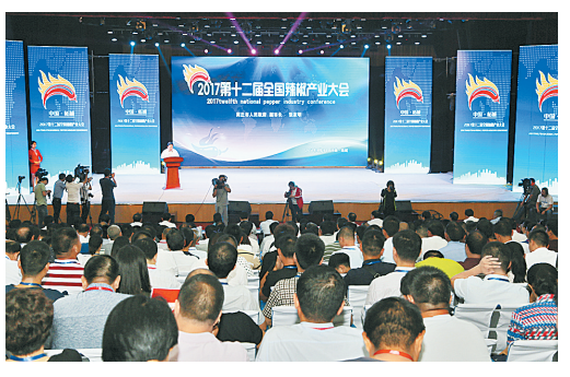
辣椒产业大会现场