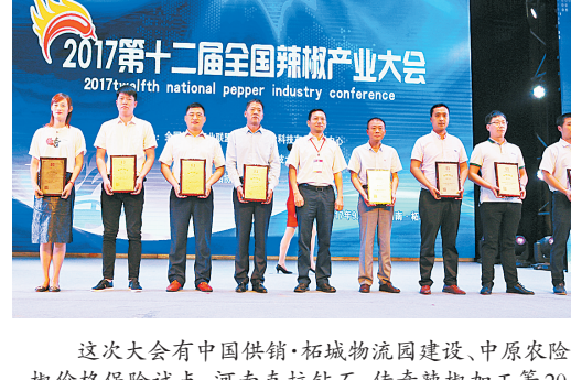
这次大会由中国供销·柘城物流园建设、中原农险辣椒价格保险试点、河南克拉钻石、传奇辣椒加工等20个项目签约，总金额120亿元。