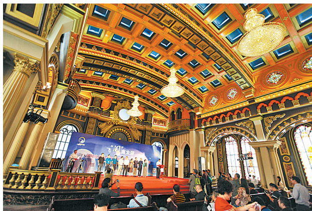
飞“阅”南太湖开镜仪式