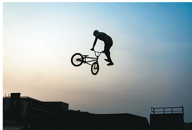
极限运动比赛在湖州举行

本次新闻摄影采访活动由中国晚报摄影学会、湖州太湖旅游度假区管委会、湖州市委外宣办、湖州日报报业集团联合主办，湖州太湖旅游度假区旅发局和湖州晚报共同承办。