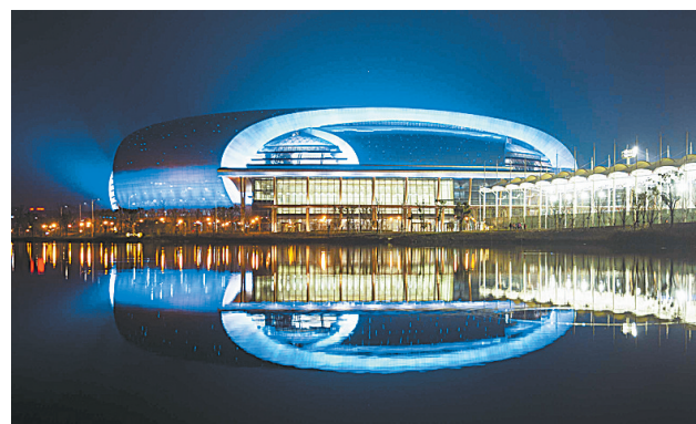
湖州奥体中心夜景