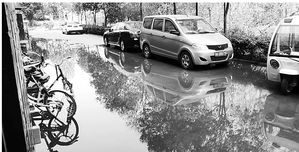
海之畔·左岸春天小区再次出现污水倒灌的情况

随后,记者再次采访了商丘市城乡一体化示范区城市管理局交通运输局市政科的工作人员。该工作人员说,因为海之