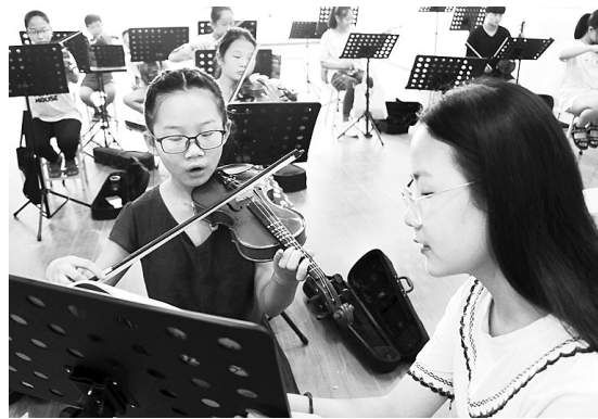
8月10日，在宁陵县阳驿乡中心小学少年宫里，乡村孩子正在用心弹奏小提琴。暑假期间，宁陵县乡村少年宫已经变成孩子们的“成长乐园”，让学生假期生活丰富而充实。