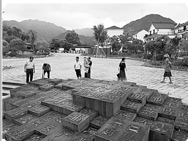
8月26日，游客在浙江龙游县溪口镇石角村参观游览

近年来，浙江省龙游县按照“一村一特色，一镇一风情”的建设思路，将文化与旅游紧密结合，打造景区村、风情小镇。据统计，2018年上半年，龙游县共接待游客666.9万人次，实现旅游总收入43.1亿元。