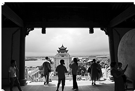
8月26日，游客在参观浙江龙游县红木小镇