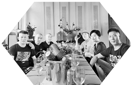
VIP会员现场品尝新品樱桃西打

啤匠还提出了“喝好不喝饱”的新健康生活标准，喝啤匠精酿1罐相当于平常工业啤酒3瓶，既不涨肚子，又能享受啤酒带给人愉悦的感受。啤匠提出的这一新消费主张受到广大酒友的一致认可，健康的酒带来的是健康的社交心态，促进了人们交流，增进了大家的感情。