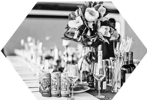
啤匠新品樱桃西打