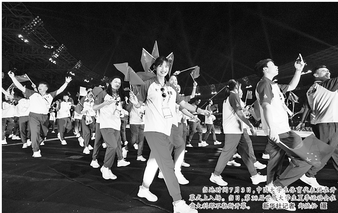
当地时间7月3日,中国大学生体育代表团在开幕式上入场。当日,第30届世界大学生夏季运动会在意大利那不勒斯开幕。