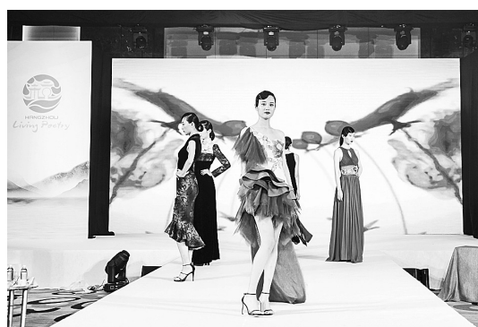
7月3日在越南首都河内拍摄的推介会上的丝绸华服秀。由中国浙江省杭州市政府主办的“丝路记忆·最忆杭州”文化旅游推介会3日在越南首都河内举行。

同时,排查整治行动将对文物、博物馆单位电气故障、用火安全、燃香烧纸、危险物品管理、设施设备状况和消防安全管理等方面的火灾隐患和问题进行重点整治。排查整治行动期间,国家文物局和应急管理部消防救援局将适时开展联合督导。