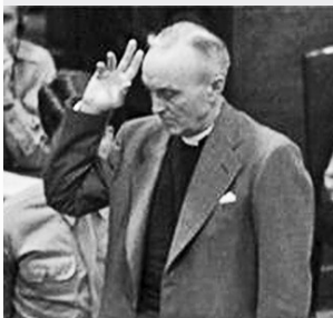
约翰·马吉在东京审判法庭上作证

1950年5月6日,在英国伦敦逝世,终年58岁。1951年5月6日在她逝世一周年时,在北京为她举行了追悼大会和隆重的葬礼。一块大理石墓碑上用金字镌刻着朱德写的碑文:“中国人民之友美国革命作家史沫特莱女士之墓。”