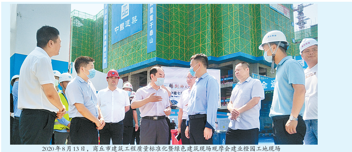
2020年8月13日,商丘市建筑工程质量标准化暨绿色建筑现场观摩会建业橙园工地现场

为深入推进房屋建筑工程质量管理标准化建设,全面提升工程质量和安全生产管理水平,商丘建业城市公司按照省、市住建部门要求,统筹推进工地疫情复工和安全生产工作,通过“三级管控”,一级管一级、层层抓落实,事前指导、过程督导、结果主导等系列强有力措施,在安全生产和质量管理标准化工地创建方面常抓不懈,可圈可点。