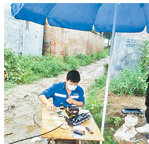
商丘移动人员正在调测设备,保障网课教学。

商丘移动利用云视讯、和直播、智慧校园云平台等工具强化教学支撑,及时办理解决客户线上教学需求。通过将教学终端、电脑、手机、PAD等有效结合,帮助学校、家庭快速部署在线课堂平台,做到即开即用,实现线上授课、线上教研、课程直播、录播回放、视频编辑以及师生互动、课件共享、家校互动、健康打卡、线上家长会等多功能多终端的高质融合。同时,增设网课投诉处理专席保证服务品质,强化物资储备支撑,做到随取随用,保障支撑系统稳定运行,做好装维人员安全防护,加强特殊区域网络保障,多方位保障线上教学。