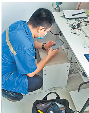
商丘移动人员入户安装宽带,保障网课教学。

受新冠疫情影响,2021年秋季商丘市中小学不能按时返校开学。自9月1日起,商丘市高中所有年级,初中八、九年级,小学二至六年级,启动线上教学。商丘移动为深入贯彻落实《商丘市新冠肺炎疫情防控指挥部教育领域工作专班办公室关于做好中小学延迟开学期间网上教学工作的指导意见》(商教体疫防办[2021]19号)要求,迅速成立网课教学保障专项工作小组,通过将网络保障、远程智能、优惠政策、扶贫活动等多角度结合,为客户提供全方位在线教育和学习资源,积极开展网上教学保障工作,做到不误教、不误学,确保网课教学顺利开展。