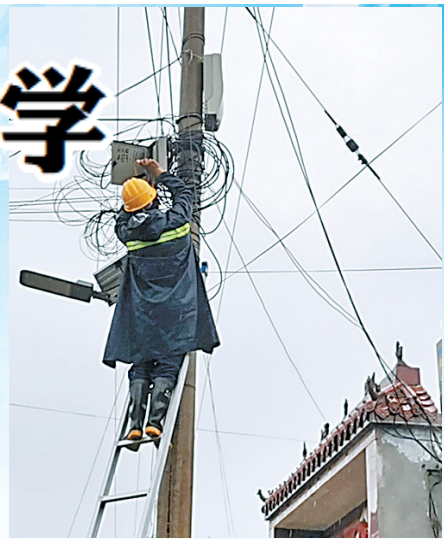
商丘移动网络工程师在阴雨天冒着危险,为有线上教学需求的客户安装宽带,保障网课教学。