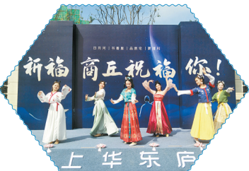
开放仪式精彩演艺