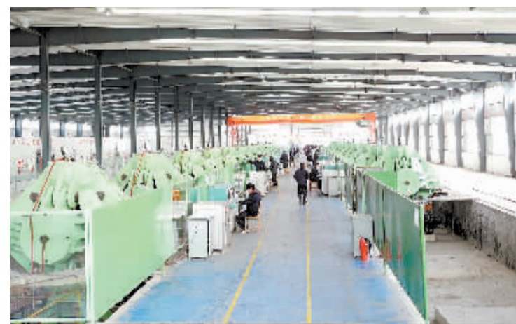
人造金刚石合成车间。