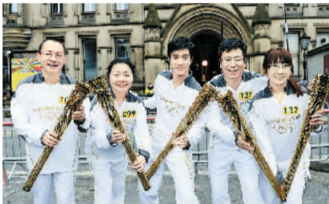
6月23日，火炬手洪杰、李文胜、王力宏、白岩松和周慧（从左至右）在火炬传递后合影。当日，2012年伦敦奥运会火炬在曼彻斯特进行传递。