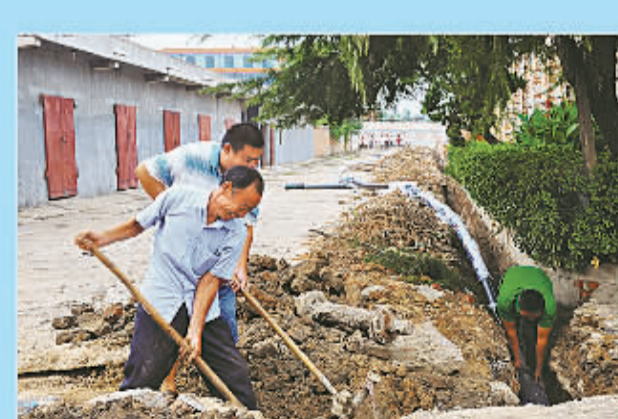
工人在进行供水管网改造