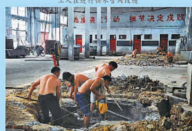
40℃高温的车间内,改造酿酒设备