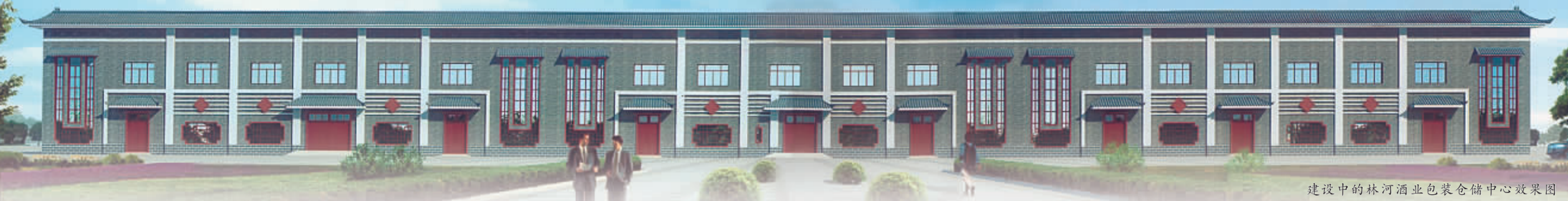
建设中的林河酒业包装仓储中心效果图