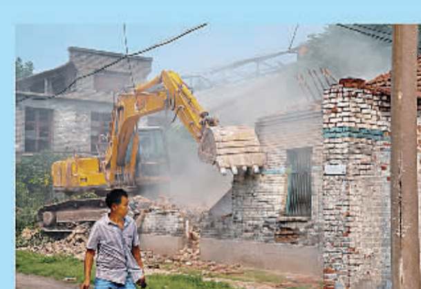
生产厂房扩建改造作业