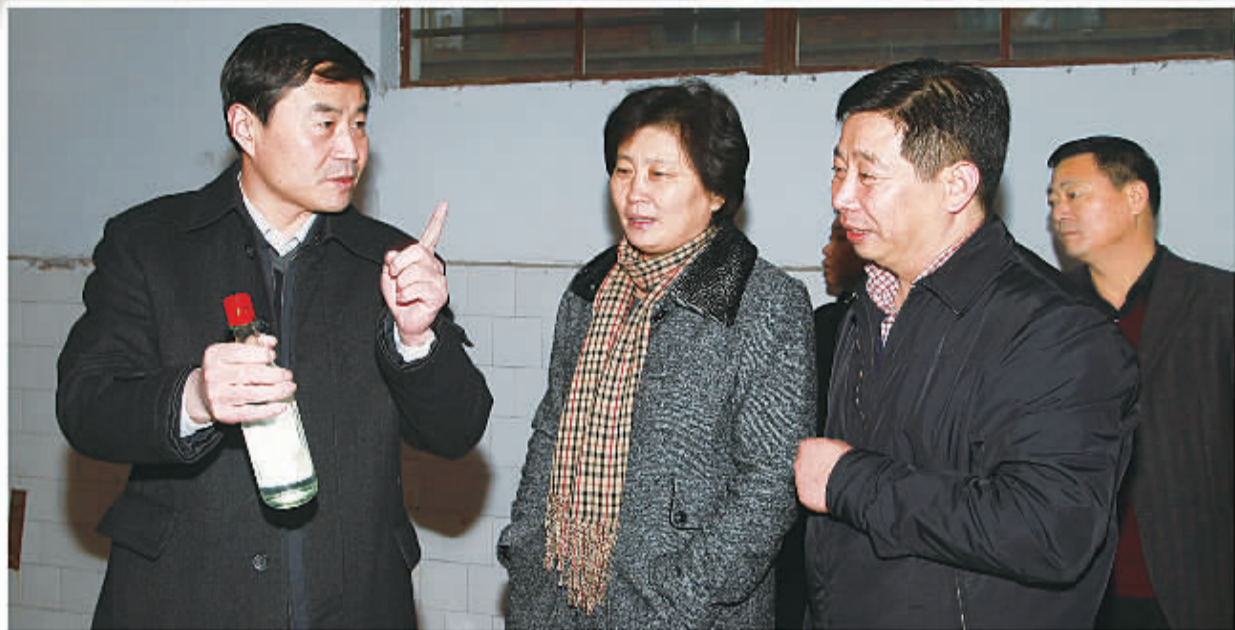
睢阳区委书记薛晓峰、区人大常委会主任翟建华到林河调研