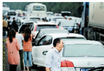
10月1日,在成都高速拥堵路段,人们在等待通车。当日是今年“十一”黄金周高速公路小客车免费通行第一天,四川境内多条高速拥堵。