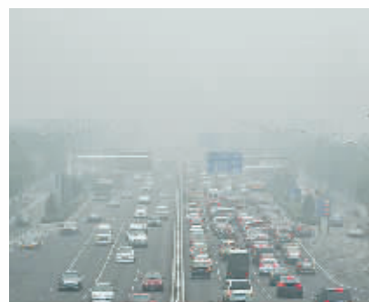
10月6日,车辆行进在大雾笼罩的国贸桥附近。当日,北京遭遇雾天。

对此,全国假日办方面强烈谴责欺骗诱导消费、威胁胁迫游客和野蛮粗暴执法的行为,目前两名涉事导游被吊销资格,涉事旅行社处以十万元罚款、停业整顿一个月,涉事执法人员被免职调离。在《旅游法》实施之际,竟然还有这样顶风作案的恶劣行为,依法严惩不仅彰显出新法权威,更将具有警示意义,在新旅游法时代维护更多游客合法权益。(新华社合肥10月7日专电)