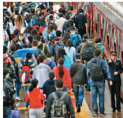
10月6日,旅客在云南大理火车站乘坐开往昆明的列车。据中国铁路总公司消息,9月30日到10月4日,铁路客流一直保持在800万以上的大客流。