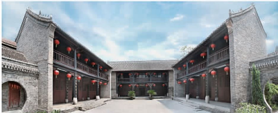
□ 103 壮悔堂