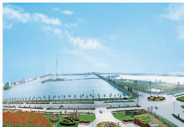
□ 111 睢县北湖