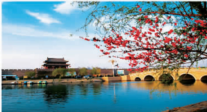
□ 101 商丘古城

主办单位：商丘市旅游局 商丘日报报业集团 协办单位：各县区旅游局 各旅游景区 媒体支持：京九晚报 商丘广播电视台 商丘网 商丘旅游网