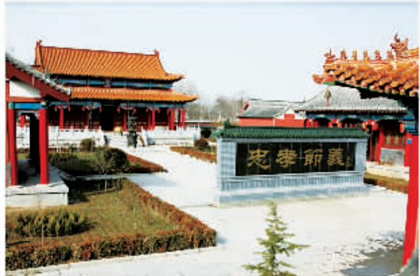
□ 114 微子祠