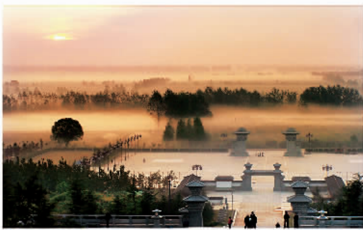
□ 105 芒砀山文物旅游区