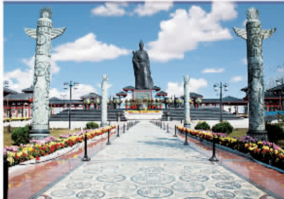
□ 115 万商广场