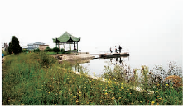
□ 117 民权龙泽湖