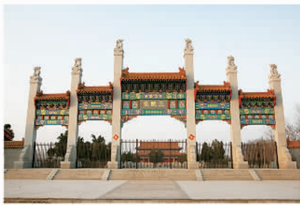
□ 109 三陵台