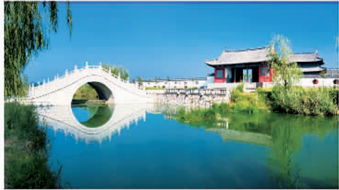
□ 113 应天书院