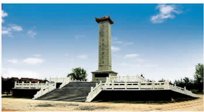
□ 116 睢杞战役纪念馆