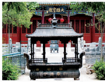
□ 121 白云禅寺