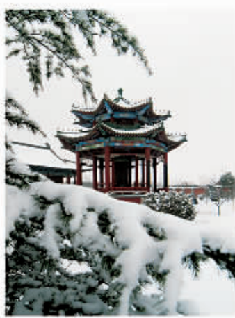
□ 104 八关斋