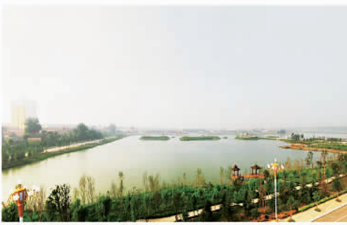
□ 107 柘城容湖