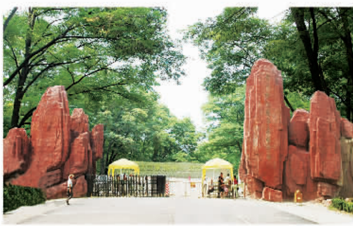
□ 106 商丘黄河故道国家森林公园