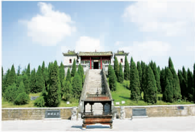
□ 108 火神台（阏伯台）