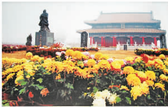
□ 118 孔子还乡祠