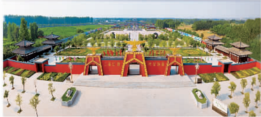
□ 102 商祖祠