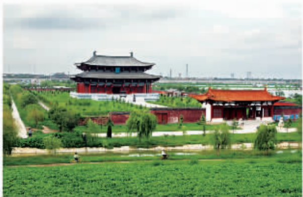
□ 112 张巡祠