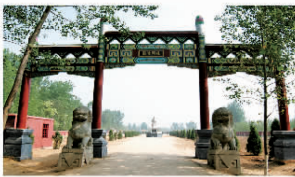
□ 119 庄周陵园