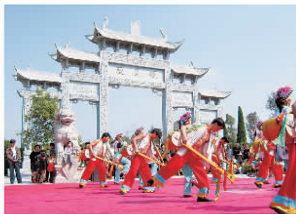
□ 110 燧皇陵