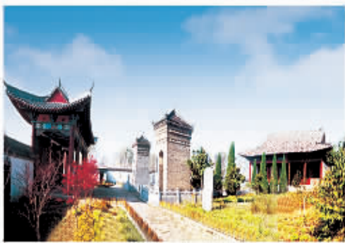
□ 120 木兰祠