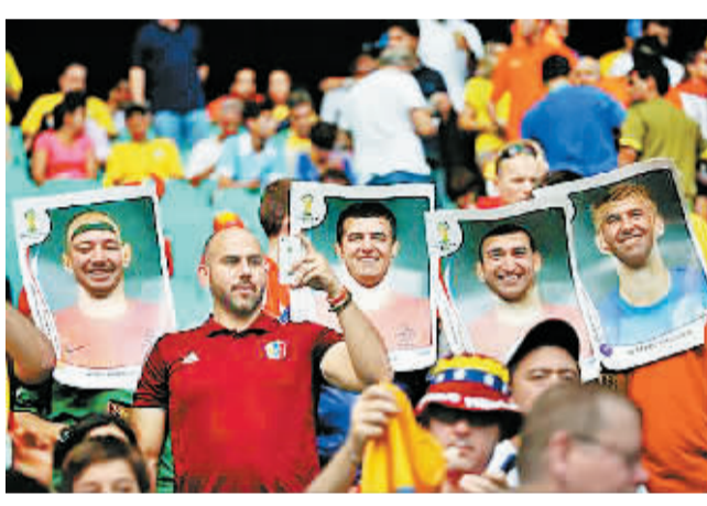
6月13日，几名球迷将自己的脸套在球星海报内。当日，在巴西萨尔瓦多新水源竞技场进行的2014年巴西世界杯小组赛B组比赛中，西班牙队对阵荷兰队。