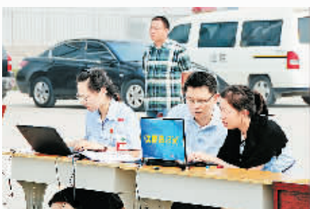
省高级人民法院微博“豫法阳光”对此案进行了全程图文直播。