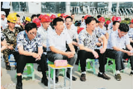
宁陵县部分人大代表、政协委员、人民陪审员团成员和农民工观摩旁听庭审。