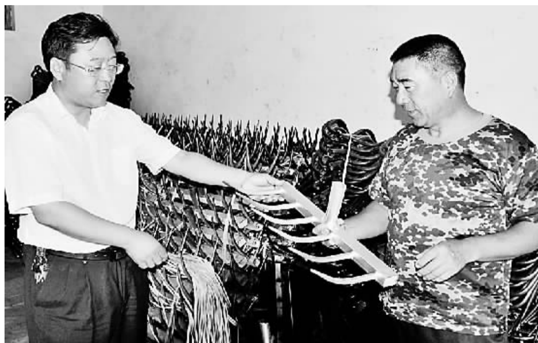
8月3日,睢县尚屯镇付庄村小型农具加工工人展示加工好的农具。该县采取多部门联合服务、政策倾斜、资金倾斜,大力扶持小微企业发展,全县已涌现出3500余家加工型小微企业,从业人员1.2万人。