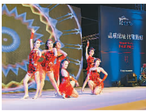
动感舞蹈“小苹果”表演现场。

晚会还通过有趣的有奖问答、智力拼图等互动形式让大家在轻松的氛围中对绿城·蓝庭项目有了进一步了解。特别设置的抽奖环节为客户带来了意想不到的惊喜,特等奖大奖价值高达3万元,购房抵金券、购车抵金券、现磨咖啡、车载吸尘器、