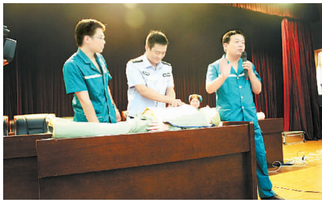
近日,针对民众公共自救互救知识缺乏、急救能力薄弱等问题,商丘市中医院集中对市公安局500多名干警进行急救知识普及,并进行了急救操作演示。

该区组织全区区级技术人员进行了操作规范、手术安全的培训;实施免费服务;为每位手术对象办理一份计划生育手术保险;对落实四项手术对象一律专车接送;为引流产者送红糖、鸡蛋;对2013年以来落实生育手术的对象,做一次面对面咨询服务活动。