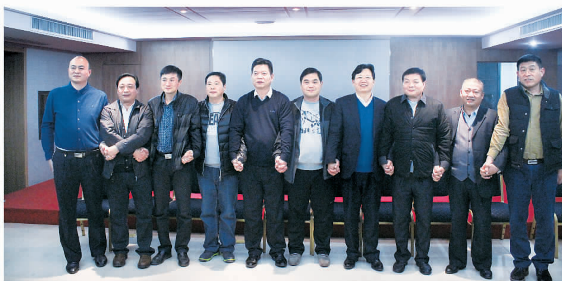
百联公司精英携手共创新程

百联公司联合农发行、国开行、建行、华商行、郑州银行商丘分行、虞城通商银行等六家银行，全体股东齐心协力，开创我市农业发展新局面。