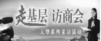
走基层 访商会 大型系列采访活动