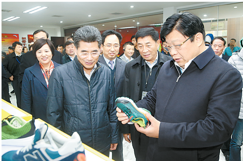
11月21日，全省体育产业工作会议在我市召开。当日，副省长张广智在市委书记王战营陪同下到梁园区体育产业生产企业参观。

本报讯（记者 孔慧）11月21日，2016年河南省体育产业工作会议在我市召开。副省长张广智，省政府副秘书长万旭，省体育局局长张文深出席会议。市委书记王战营，市长张建慧，市领导吴祖明、岳爱云陪同参观或出席会议。