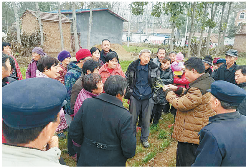
▲为助力脱贫攻坚行动,努力实现造血式、精准式扶贫,提高农户增产增收能力,11月20日,宁陵县扶贫办、农业局、职业培训中心等专家来到该县乔楼乡吴楼村(宁陵县卫计委扶贫点),对贫困户中的劳动力开展种植、养殖等技术培训。参加此次培训的农民有200多人,均表示受益匪浅。