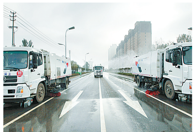
11月21日,睢阳区城管局正在全区开展“洗城行动”。该局以“三机”联合作业模式为主,坚持每天对城区道路“一洗一冲两扫六洒、快速拾捡”,还清风于民、还清水于民、还清洁于民。

本报讯(记者 邵群峰 通讯员 李伟)为进一步提高人居环境,改善空气质量,近日,睢阳区宋城办事处根据城市管理特点,实行“错时工作法”,取得良好社会效果。 据了解,“流动商贩下班期间无人管理”一直是城市管理的老大难问题。为了解决此类问题,使城区流动摊贩无处可钻,宋城办事处突破常规,采用“错时工作法”,将工作人员分成两班,打破8小时工作制,实行错时上下班,且夜班工作人员值班到晚上10点,有效杜绝了出店经营、占道经营及流动商贩等问题,实现了辖区市容市貌全天候监控管理。 据统计,“错时工作法”实行以来,宋城办事处下辖的2个社区和5个行政村共劝离流动摊点20处、清理乱倒乱洒乱挂现象30次,出动挖掘机6辆、铲车3辆、垃圾运输车8辆,清理垃圾8.7吨,辖区的市容秩序明显好转。