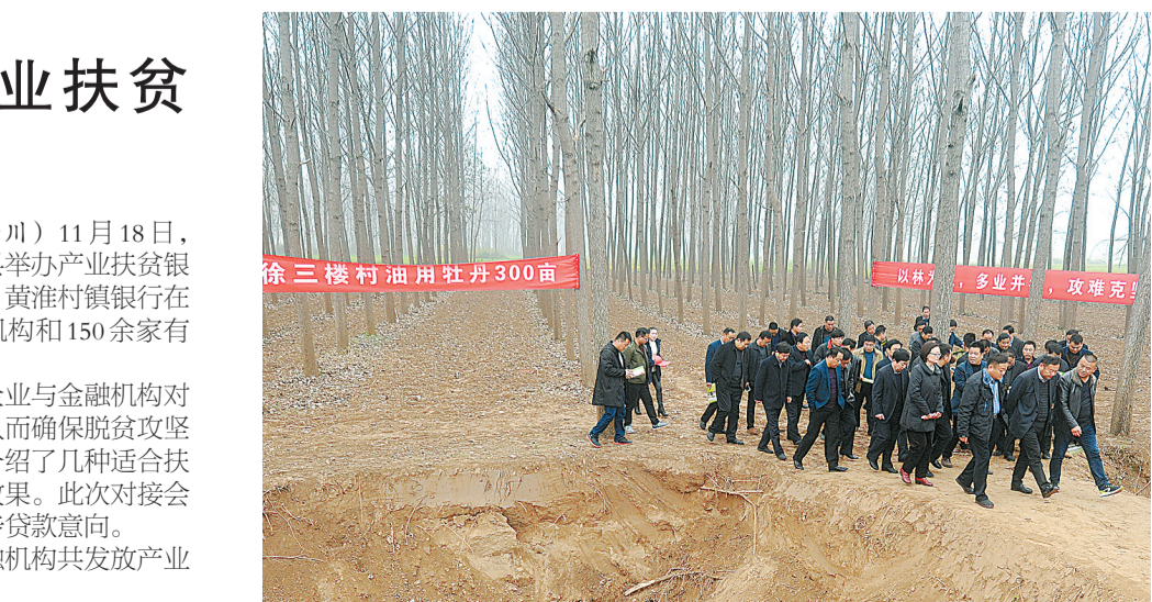
▲11月21日,夏邑县组织相关人员在马头镇参观林下种植油牡丹。该项目是贯彻落实省政府《关于加快木本油料产业发展的实施意见》的重要工程。油牡丹籽提炼的木本植物油,有“血液营养素”之称,每亩综合效益可达万元。该县计划三年林下种植油牡丹10万亩,为群众脱贫致富开辟新途径。

本报讯(记者 蒋友胜 通讯员 郭子川)11月18日,为推动金融扶贫工作的深入开展,柘城县举办产业扶贫银企对接会。该县农村信用社、中原银行、黄淮村镇银行在会上作了表态发言,各乡镇、9家金融机构和150余家有扶贫贷款需求的中小微企业参加了对接。 举办产业扶贫银企对接会,旨在为企业与金融机构对接架起桥梁,解决企业融资难的问题,从而确保脱贫攻坚工作扎实有效开展。各家金融机构分别介绍了几种适合扶贫企业不同类型的特色产品,收到明显效果。此次对接会上,共有45家企业与金融机构达成了初步贷款意向。 据统计,截至目前,柘城县各家金融机构共发放产业扶贫贷款金额1.86亿元。