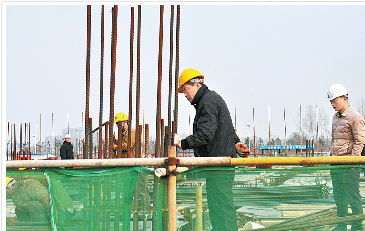
文化艺术中心 工地施工忙

2月26日,商丘市文化艺术中心工地上工人正在施工。该项目位于城乡一体化示范区,总投资8.1亿元,占地123亩,总建筑面积为67033平方米,包括群众艺术馆、大剧院、科技馆、地下工程四部分,建成后将进一步完善城市功能、提升城市品位、繁荣文化事业,满足人民群众日益增长的精神文化需求。