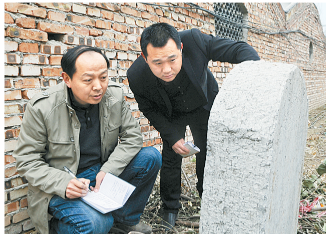
本文作者与文化顾问在平台碑前探访交流

两千多年来，“三百里梁园”的文化盛景，以深厚的文化底蕴矗立于中国古典文学殿堂，在作为西汉梁国国都的商丘古城，汉梁文化也成为后人探讨传承的追捧选题。