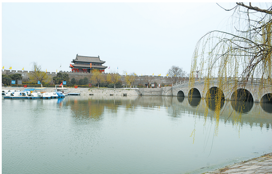
商丘古城南城湖下，叠压着汉朝梁国都城睢阳城

如今在睢阳区勒马镇、宁陵县张弓镇等地，仍流传着王莽赶刘秀、“刘秀勒马回头望张弓”的故事。史载，光武帝刘秀公元25年建立东汉政权后，兴兵讨伐刘永，围困睢阳城数月之久。刘永先后逃往虞城、亳州，两年后潜回睢阳又遭围攻，