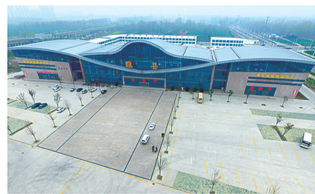
睢县客运物流中心