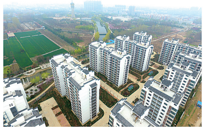
大棚户区改造项目