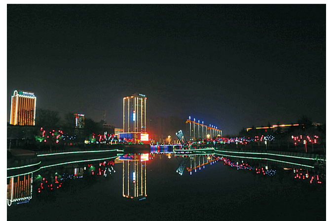
二等奖:商丘运河夜景。