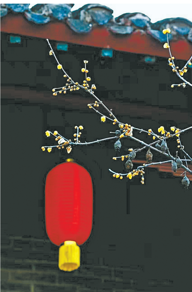
一等奖:穆氏四合院,腊月蜡梅满枝头。