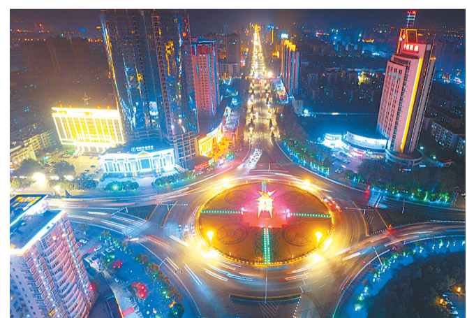
二等奖:越夜越美丽。魏文慧 摄

据了解,本次活动以讲述商丘好故事、描绘商丘好风光、传播商丘好声音、展示商丘好风尚、提升商丘美誉度为总要求,得到了几千名网友的投稿,微博话题阅读量1000万次,进入全国政务话题排行榜第一名。通过这些精美的作品,让更多人了解商丘、关注商丘,极大地提升了商丘的知名度和美誉度。