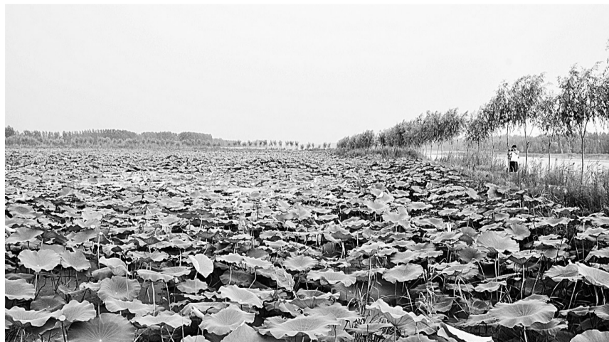
孙福集万亩荷塘。