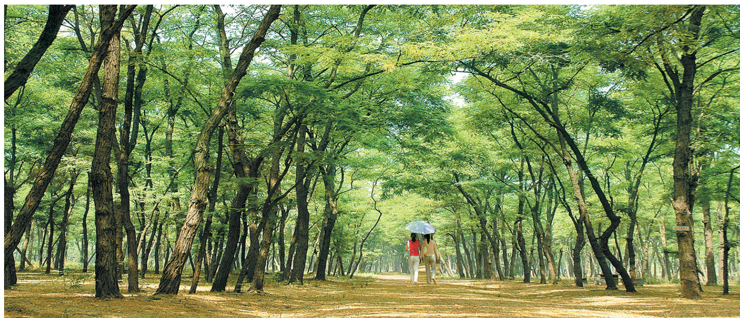
平原林海