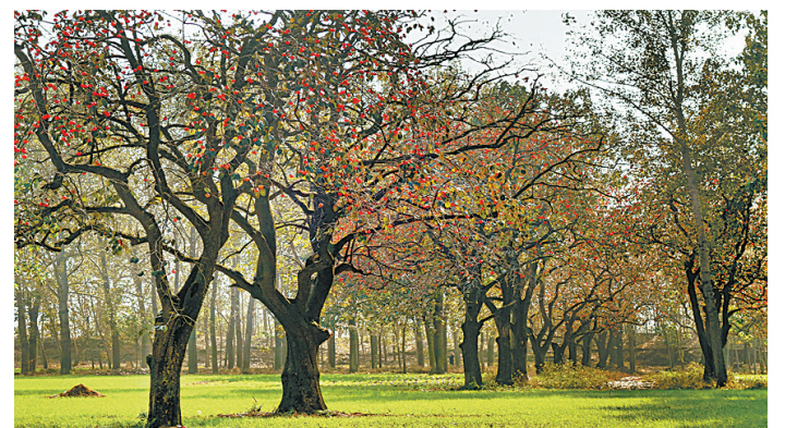
朱楼古柿园