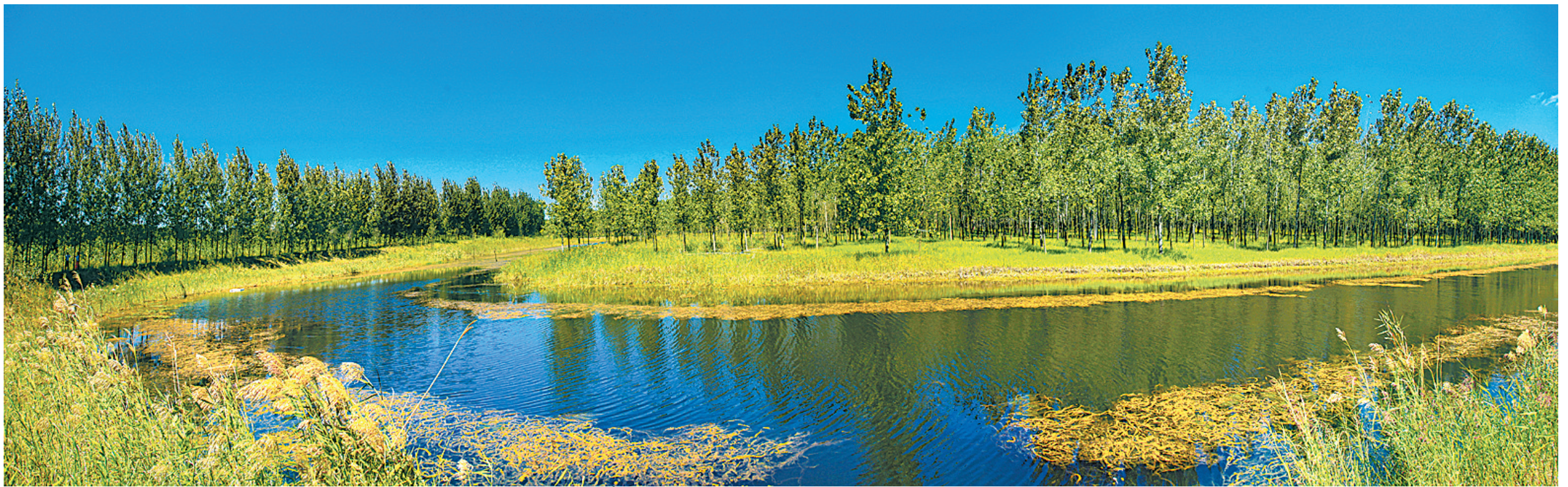
故道晚秋