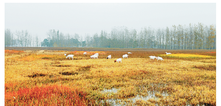
湿地秋色