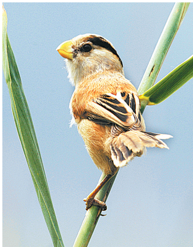
震旦鸦雀