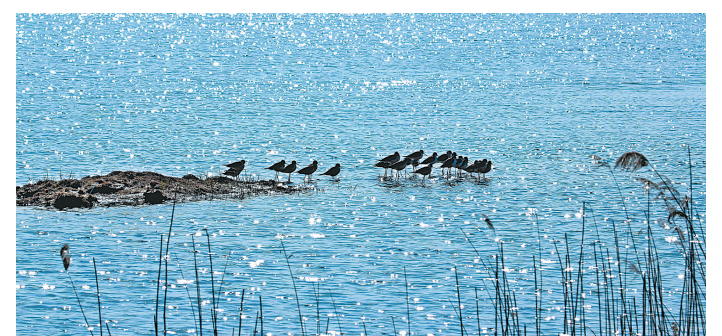
万亩水面