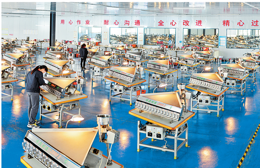
壮观的金刚石筛选车间。

党的十九大报告从四大方面提出了实施创新驱动发展战略,加快建设创新型国家的具体举措。柘城县从曾经的“全国微粉之乡”蝶变“中国钻石之都”的过程,正是柘城县实施创新驱动、拉长产业链条、提升产品科技含量的成功实践。