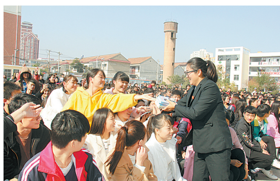
11月2日,柘城县人民法院法官走进该县职业技术学校,为3000余名师生上了一堂精彩生动的法制教育课。

任,聚焦中心工作,明确职责定位,突出主责主业,加强执纪问责。他们创新工作机制,综合运用案件监督卡、“三回访两约谈一查处”等方式,探索新形势下审判权、执行权良性运行机制及监督制约机制。同时,严格落实廉政谈话、约谈机制,落实好两个责任“双报告”制度;严格监督检查,建立责任台账,开展专项检查,及时通报结果;完善考核机制,创新考评办法,健全考评机制,充分发挥考评的激励导向作用,注重考核结果,强化责任追究。