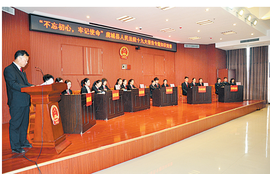
11月7日,虞城县人民法院举行学习党的十九大精神专题知识竞赛。

针对涉及民生的案件,该院在执行过程中,开辟绿色通道,由一名副局长带队,定人定岗定车辆,24小时坚守“阵地”,“快”字当头,确保民生案件优先,切实保障当事人的合法权益。案件进入执行程序后,实施繁简分流,提高执结效率。