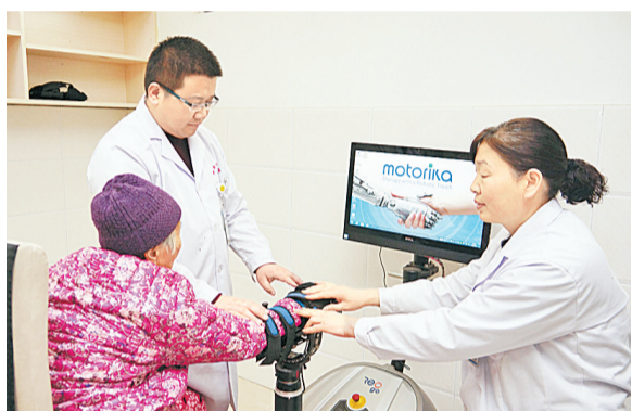
康复科使用上肢康复机器人对患者进行治疗