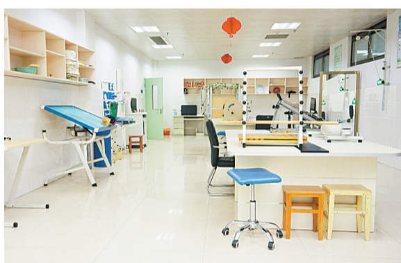
康复科部分医疗器械