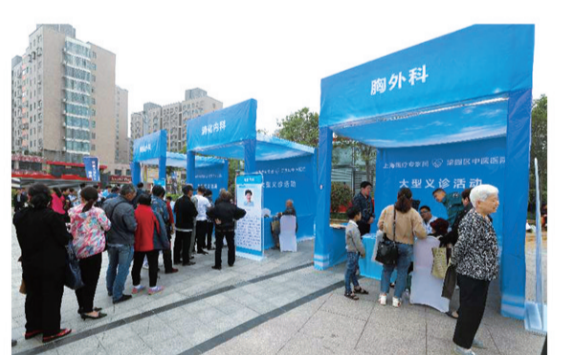
组图：大型义诊现场