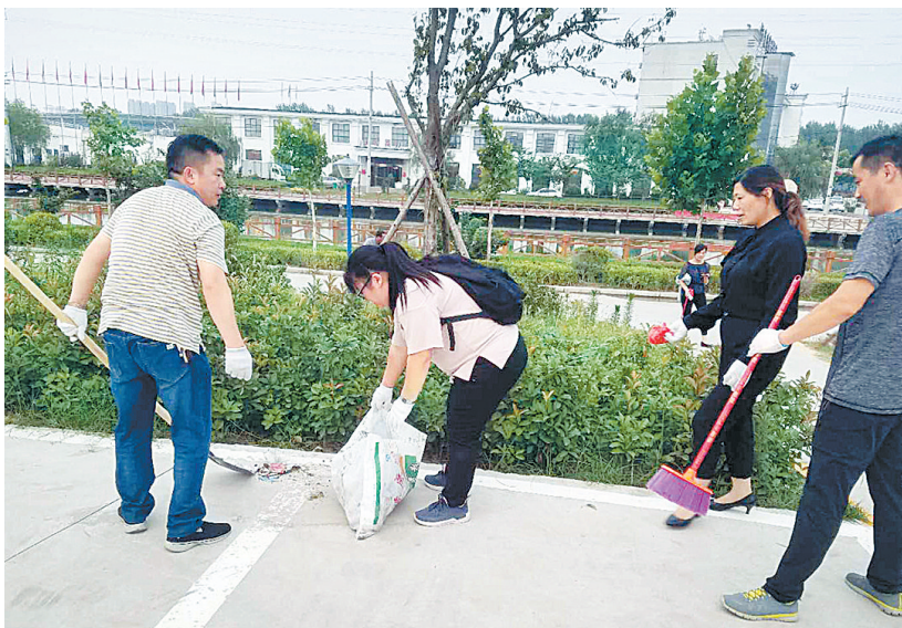
6月20日，民权县住建局党员干部在奥林匹克公园打扫卫生。据悉，为争创省级文明县城和省级文明单位工作，该局开展了百名党员干部职工义务劳动活动，以实际行动为改善城市环境、建设美好家园尽一份力、出一份力。