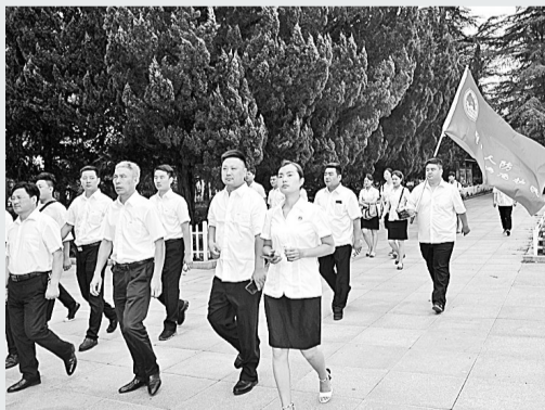
7月6日,睢阳区人防办进行机关“准军事化”集训。此次集训采取理论学习与现场教学相结合的方式,促进了睢阳区人防“准军事化”机关建设。