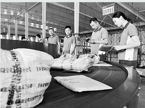
7月10日,工作人员在电子分拣系统上查看邮件。今年以来,中国邮政夏邑县分公司整合现有网络及生产资源,安装电子分拣系统,保障报刊、邮件传输的及时性和安全性。