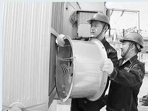
7月9日,工人为民权县35千伏鲁庄变电站安装降温“神器”。高温天气,民权县供电公司采取在主变散热器上加装低噪声轴流管道通风机的方式,确保供电设备安全运行。