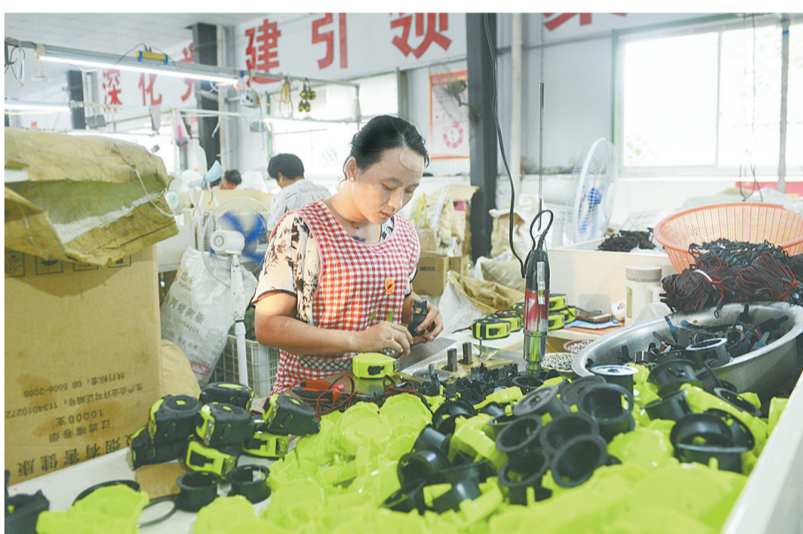
8月21日，虞城县稍岗镇书店村村民在扶贫车间作业。该村扶贫车间运营以来，累计吸收周边4个村贫困务工人员120人次，带动脱贫37户，让困难群众在自家门口实现了就业，实现了“一户就业，全家脱贫”。