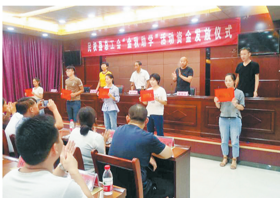
8月23日，民权县总工会举行“金秋助学”资金发放仪式。当日，全县92名困难职工(农民工)的子女得到救助金28.6万元，帮助他们共圆大学梦。