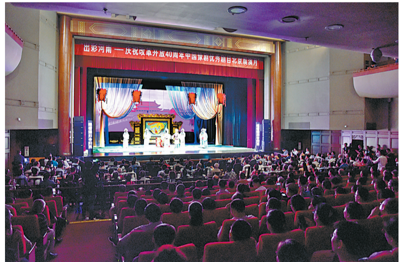
座无虚席的演出现场。

他自己这样说：“金杯银杯不如老百姓的口碑，金奖银奖不如老百姓夸奖。作为一名演员，让观众满意才是最大的收获，在这条路上，我要走完最后一米！”