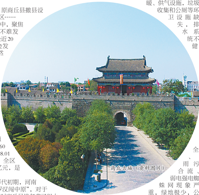
全、雨、污合流、弱电强电蜘蛛网现象严重，绿地极少，公

“数风流人物，还看今朝”。行走在商丘古城青石板的小街上，感受岁月更迭，更觉今天的美好生活来之不易。习近平总书记说：“今天，我们比历史上任何时期都更接近、更有信心和能力实现中华民族伟大复兴的目标。”在商丘古城，在日新月异的变化中，在群众洋溢的自信的笑容中，我们听到了新时代的足音。