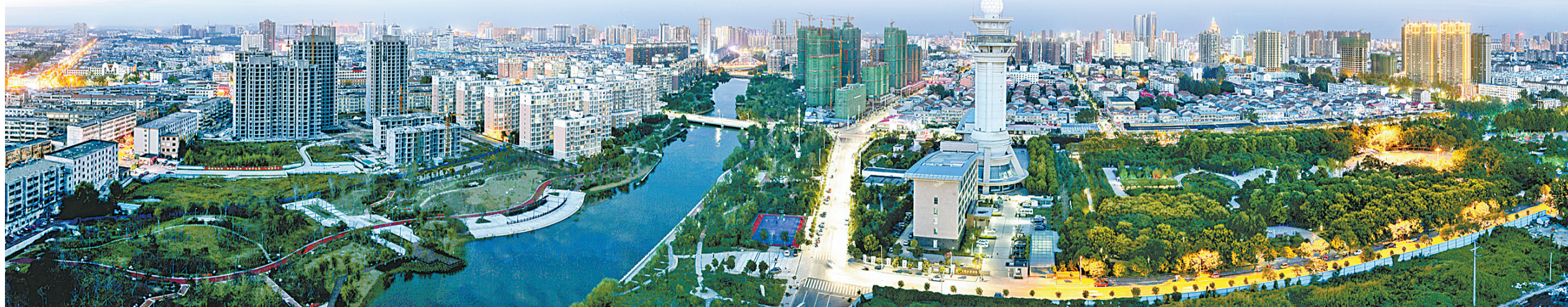
睢阳新貌（资料图片）